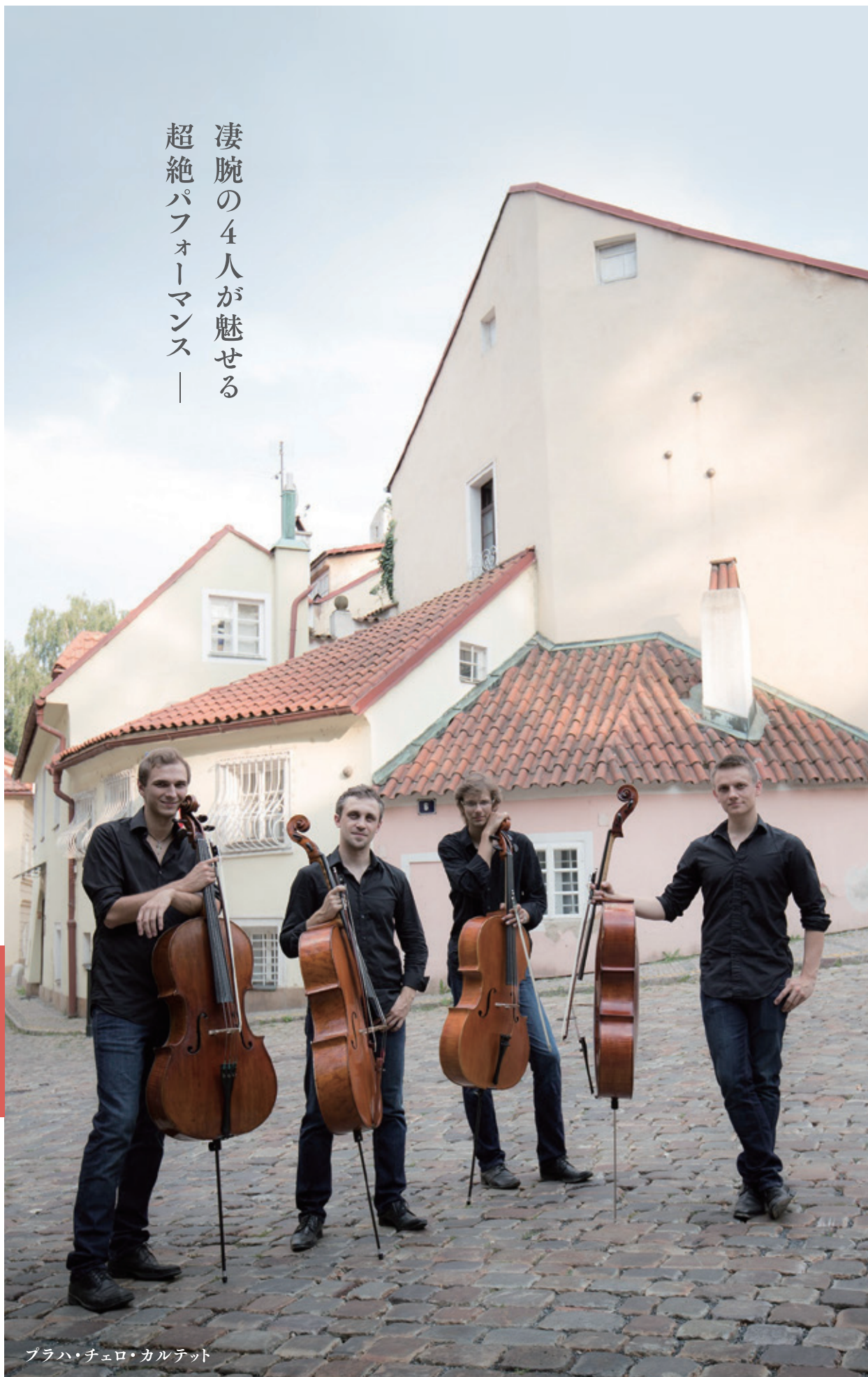
ブラハ・チェロ・カルテット