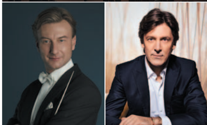
指揮:クリスチャン・アルミンク クラリネット:ポール・メイエ

今年、創立90周年を迎えるNHK交響楽団。日本を代表するオーケストラの公式国内ツアーとして三原公演を行います。指揮はウィーン生まれのクリスチャン・アルミンク。ソリストに、世界のトップクラリネット奏者のひとり、ポール・メイエを迎え、モーツァルトや「新世界」など、期待満載の名曲をお届けします。