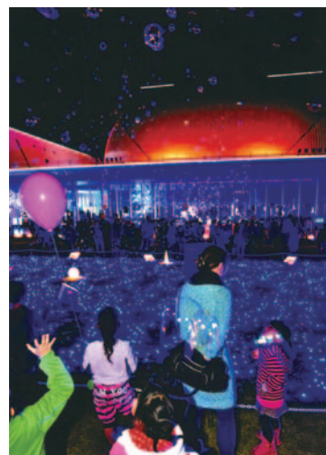
グランプリ作品「きらめく夕べ」

期間:2月6日(土)~14日(日) *最終日は16時まで 会場:ホワイエ 入場料:無料