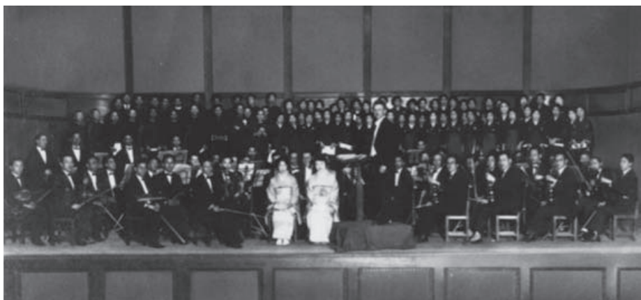
1927年5月6日 新響(N響)最初の第九 日本青年館

れるとともに、国際放送を通じて欧米やアジアにも紹介されている。また、二〇一三年八月にはザルツブルク音楽祭に初出演するなど、その活動ぶりと演奏は国際的にも高い評価を得ている。