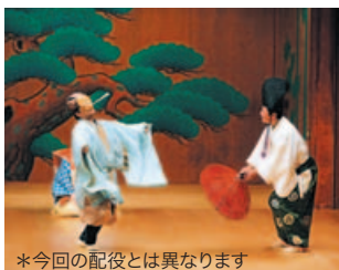
*今回の配役とは異なります

室町時代から続く伝統芸能 — 狂言。人気の狂言師、野村萬齋の解説付きで、子どもから大人まで楽しめる二番組(演目)を上演します。