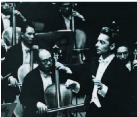
1954年4月14日 ヘルベルト・フォン・カラヤン指揮 日比谷公会堂356回定期公演

近年NHK交響楽団は、年間五四回の定期公演をはじめ、全国各地で約一二〇回のコンサートを開くなど、その演奏は、NHKのテレビ、FM放送で日本全国に放送さ