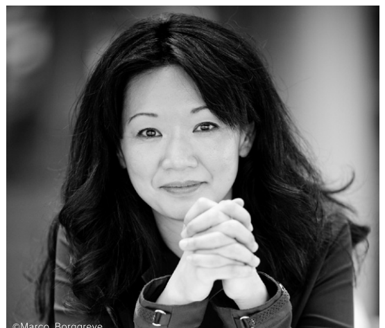
児玉 桃 Momo Kodama, piano

J.S.バッハからメシアンを含む現代作品まで、幅広いレパートリーと豊かな表現力で活躍を続ける国際派。幼少の頃よりヨーロッパで育ち、パリ国立音楽院に学ぶ。1991年、ミュンヘン国際コンクールに最年少で最高位に輝く。その後、ケント・ナガノ指揮ベルリン・フィル、小澤征爾指揮ボストン響、ベルリン・ドイツ響、北ドイツ放送交響楽団との共演、デュトワ指揮NHK交響楽団とのアジアツアーのソリストを務めるなど着実に世界的なキャリアを築く。2008年は、メシアン生誕100年を記念したシリーズ公演(全5回)を行い高い評価を得た。2013年にはルツェルン音楽祭、ウィグモアホール、東京オペラシティ文化財団の共同委嘱による「細川俊夫：練習曲集」をルツェルン音楽祭にて世界初演、12月には東京オペラシティにて日本初演、翌年ロンドン・ウィグモアホールでも演奏。最近の活動としては、ウィーン・ムジークフェラインへのデビュー(メルクル指揮ウィーン・トーンキュンストラー管)、ノリントン指揮フランス放送フィル、フォスター指揮パリ室内管弦楽団との共演をはじめ、室内楽では、ベルリン・コンツェルトハウスでの室内楽など、ヨーロッパでも活躍の幅を広げている。CDはオクタビア・レコードより「ドビュッシー：impressions」、「ショパン：ピアノ作品集」「メシアン：幼子イエスに注ぐ20のまなざし」がリリースされており、ヨーロッパでも高い評価を得ている。2010年1月にはメシアンの「鳥のカタログ」全集をリリース。ECMよりリリースされたCD「鐘の谷〜ラヴェル、武満、メシアン：ピアノ作品集」は、ニューヨーク・タイムズ、サンフランシスコ・クロニクル、ル・モンド・ド・ラ・ムジーク、仏クラシカ・マガジン、テレマ等で大絶賛を博し、2017年には最新アルバムとしてECM第2弾、「点と線・ドビュッシー & 細川俊夫：練習曲集」をリリースし、注目を集めている。2009年中島健蔵音楽賞および、芸術選奨文部科学大臣新人賞を受賞。パリ在住。