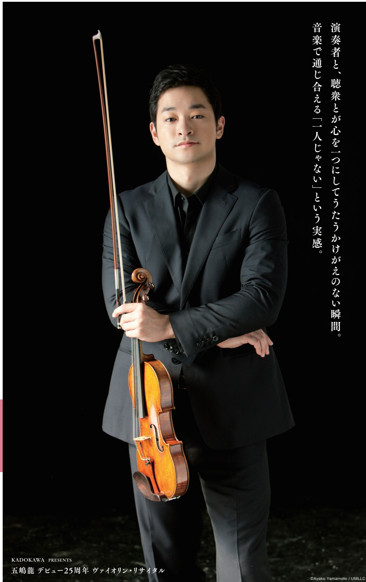
KADOKAWA PRESENTS 五嶋龍 デビュー25周年 ヴァイオリン・リサイタル

演奏者と、聴衆とが心をつなげてうたうかけがえのない瞬間。音楽で通じ合える「一人じゃない」という実感。