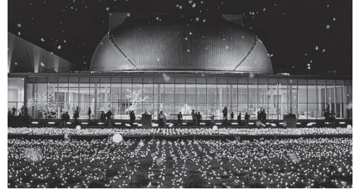
ウィンターイルミネーション2022の様子