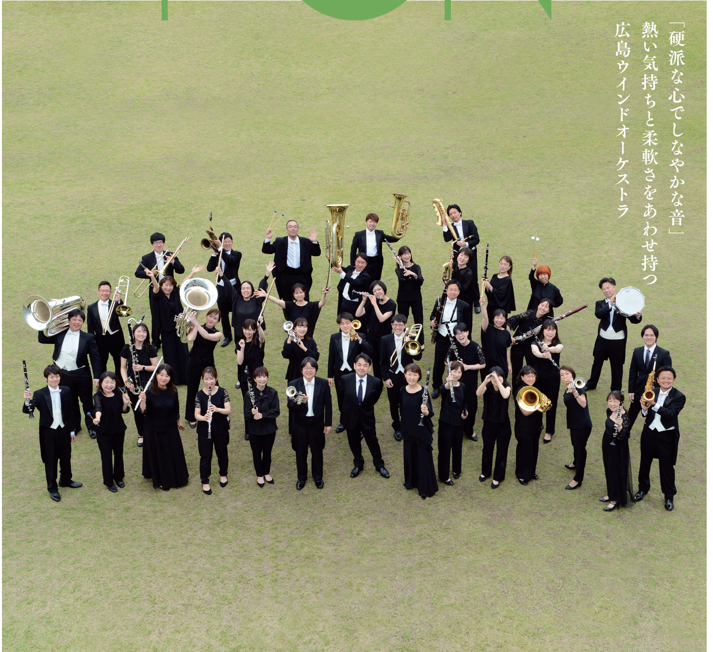
広島ウインドオーケストラ 三原特別公演2026

「硬派な心でしなやかな音」 熱い気持ちと柔軟さをあわせ持つ 広島ウインドオーケストラ